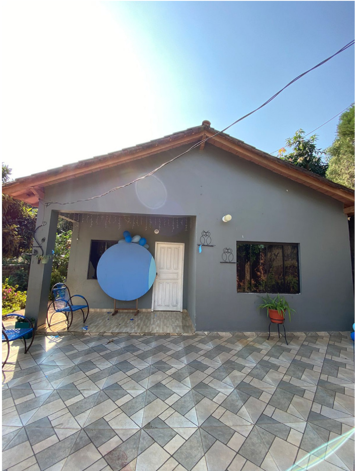
Casa de los padres